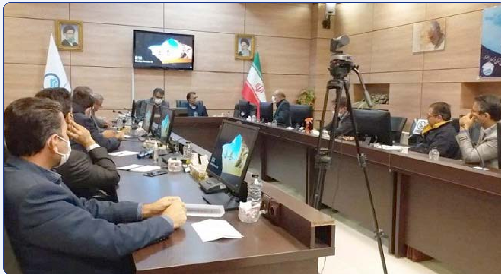
مدیرعامل آبفا استان اعلام کرد: