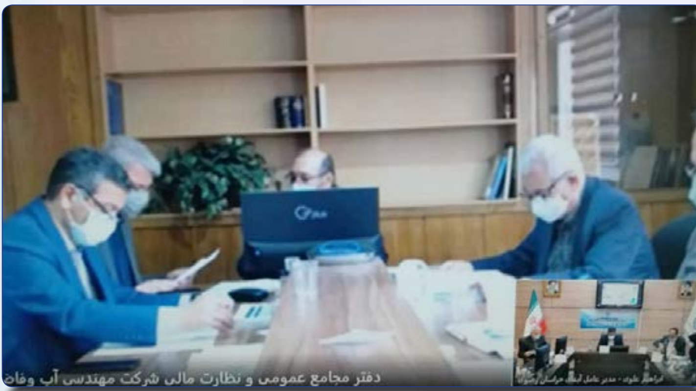
دفتر مجامع عمومی و نظارت مالی شرکت مهندسی آب و فاضلاب